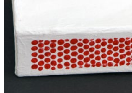
Abb. 22 (l. o.) Objektdetail: Streichholz, allein