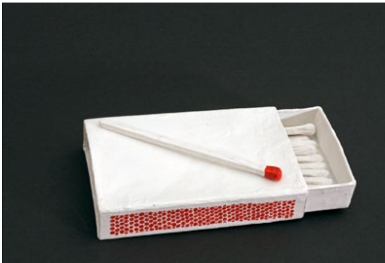
Abb. 24 (l. u.) Original Streichholzschachtel